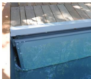
Exemple de caillebotis en ipé et de parois de volet immergé.