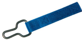
Anneaux de fixation inox anti-soulèvement