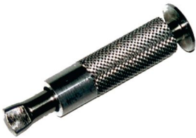
Piton douille inox Alu