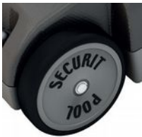
Grandes et larges roues pour une meilleure stabilité ergonomique.