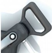
Poignée de transport Ergonomique.