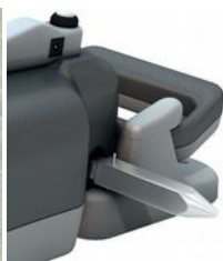
Carré positionnable à droite ou à gauche.