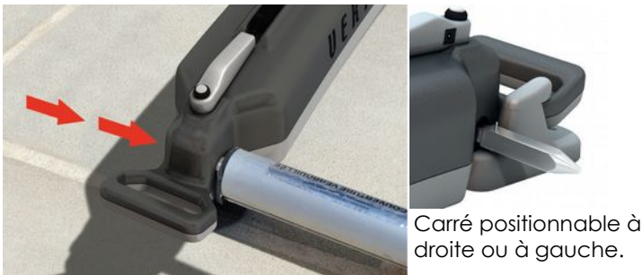
Carré positionnable à droite ou à gauche.