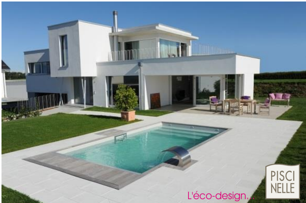
Piscinelle Cr7b – A partir de 11 757€ - 7m x 3,45m

Cliquez sur les visuels pour télécharger la version haute définition.