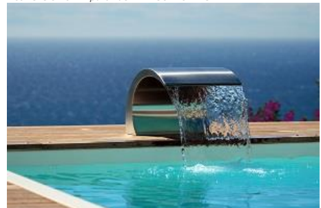
Lame d'eau Piscinelle – 2 180€