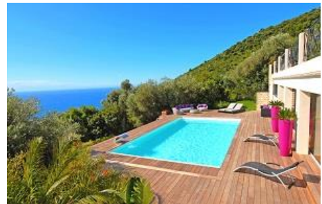
Piscinelle Cr10 – A partir de 21 778€ - 10m x 5m