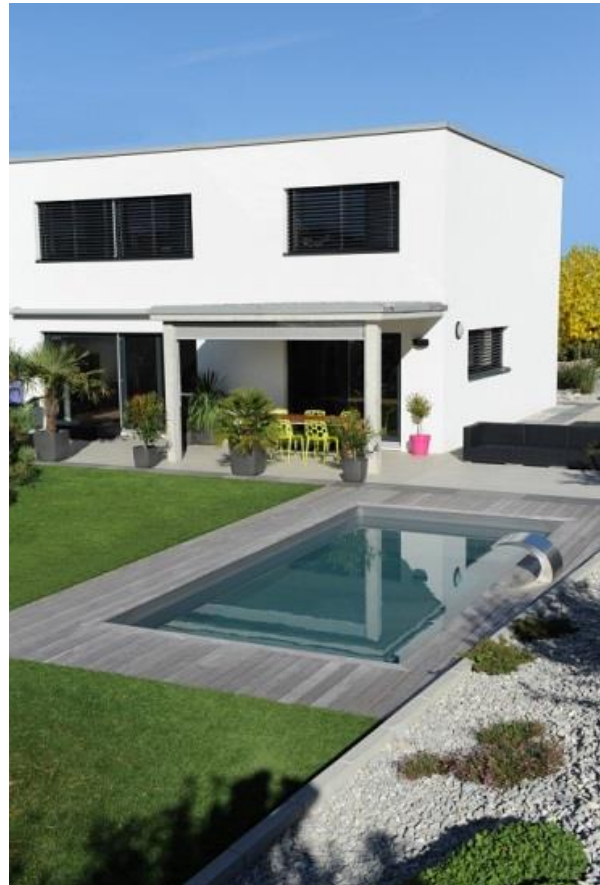
Piscinelle Cr6b – A partir de 9 321€ - 5,99m x 2,93m

Une Piscinelle apporte de nombreuses réponses en termes économiques et notamment le fait qu'elle ait été pensée pour être construite aisément et rapidement, fabriquée pour durer, facile à entretenir. Pour les plus courageux (qui ne sont pas forcément les plus bricoleurs) il est même tout à fait possible monter sa piscine soit même (comme plus de la moitié des clients de Piscinelle chaque année).