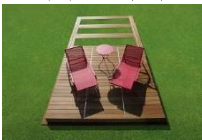
Piscinelle Rolling Deck – A partir de 3 560€