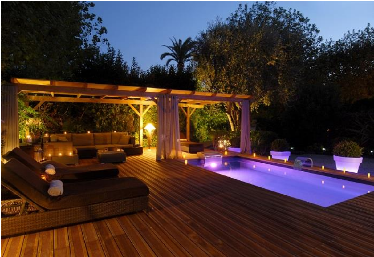
Piscinelle Iki – A partir de 11 870€ - 5,49m x 1,82m