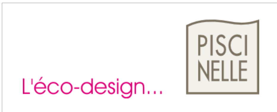
Nouvelle signature Piscinelle